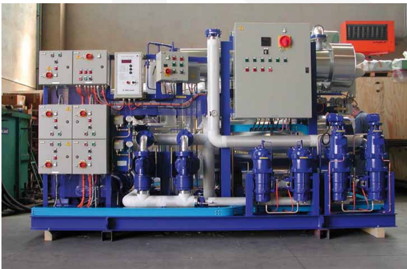
Gruppo alimentazione motori navali - Alfa Laval S.p.A.