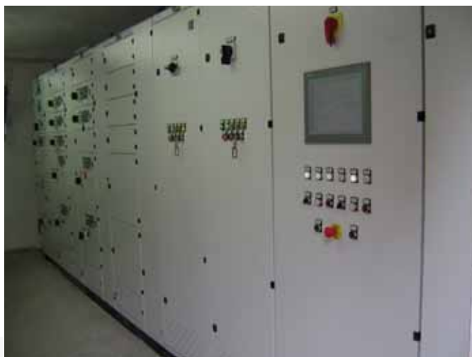
Quadri elettrici MCC per impianto V.O.D.