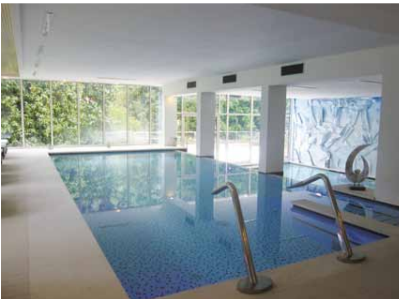
Centro Benessere piscina e area relax - Terme di Boario (BS)