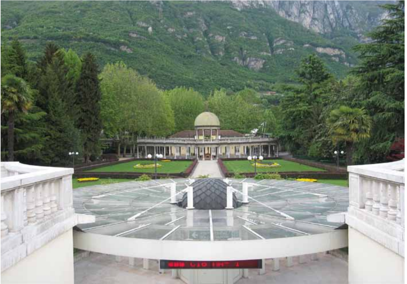
Esterno - Terme di Boario (BS)

progettazione e realizzazione impianti elettrici | civili | industriali | fotovoltaici