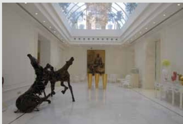
Ingresso Hall - Hotel Boscolo "Exedra" - Nizza