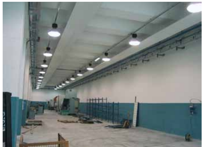
Realizzazioni elettriche reparto trince Cirillo Gnutti - Lumezzane