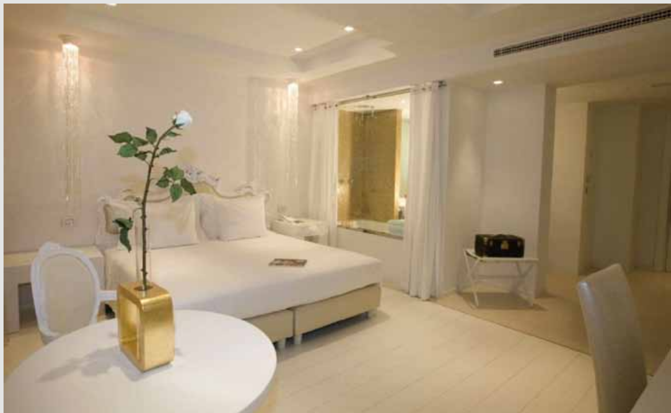
Camera - Hotel Boscolo "Exedra" - Nizza