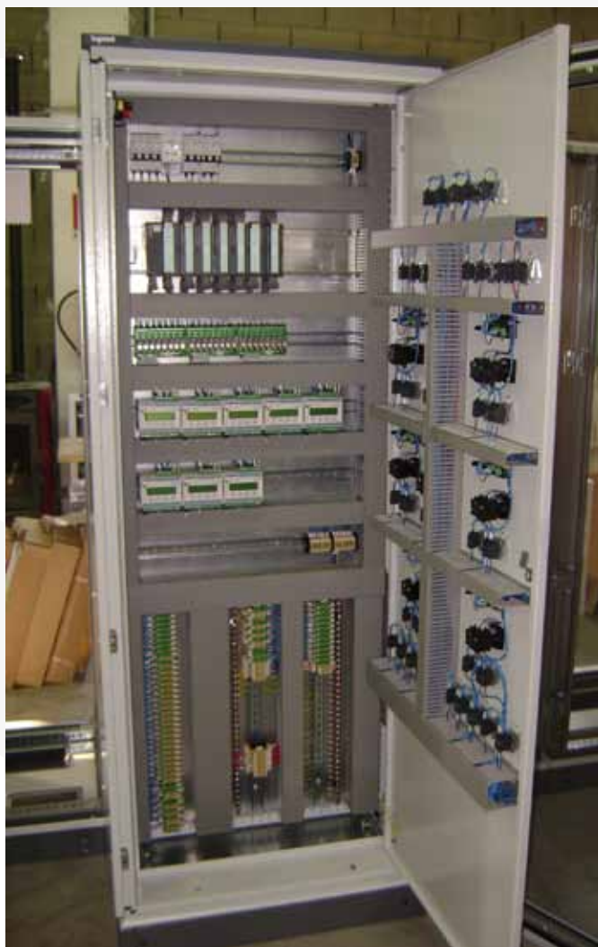
Impianto elettrico celle di pesatura per tramogglie, Acciaierie Trier - Germania.