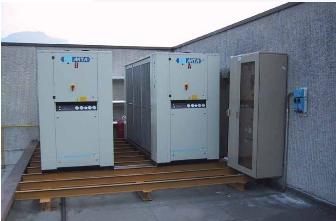
Gruppo condizionamento reparto di produzione - Brawo Brassworking