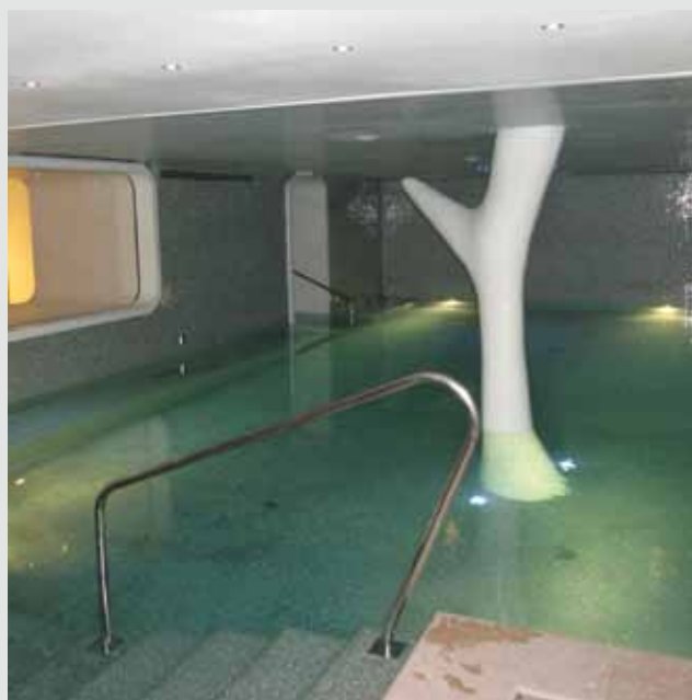
Centro Benessere e sala da pranzo - Hotel Boscolo "Exedra" - Nizza