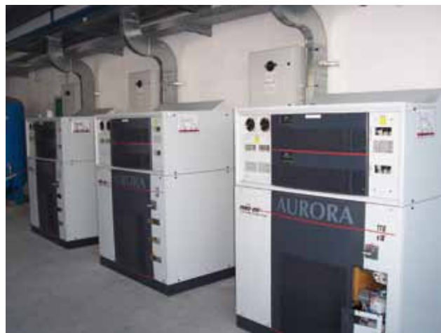
Inverter per impianti fotovoltaici