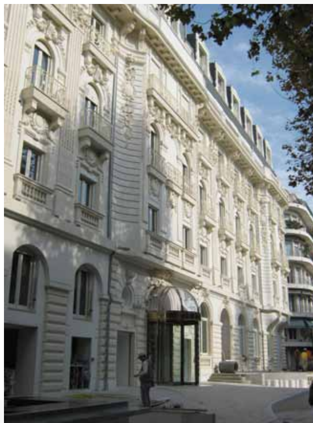
Hotel Boscolo "Exedra" - Nizza