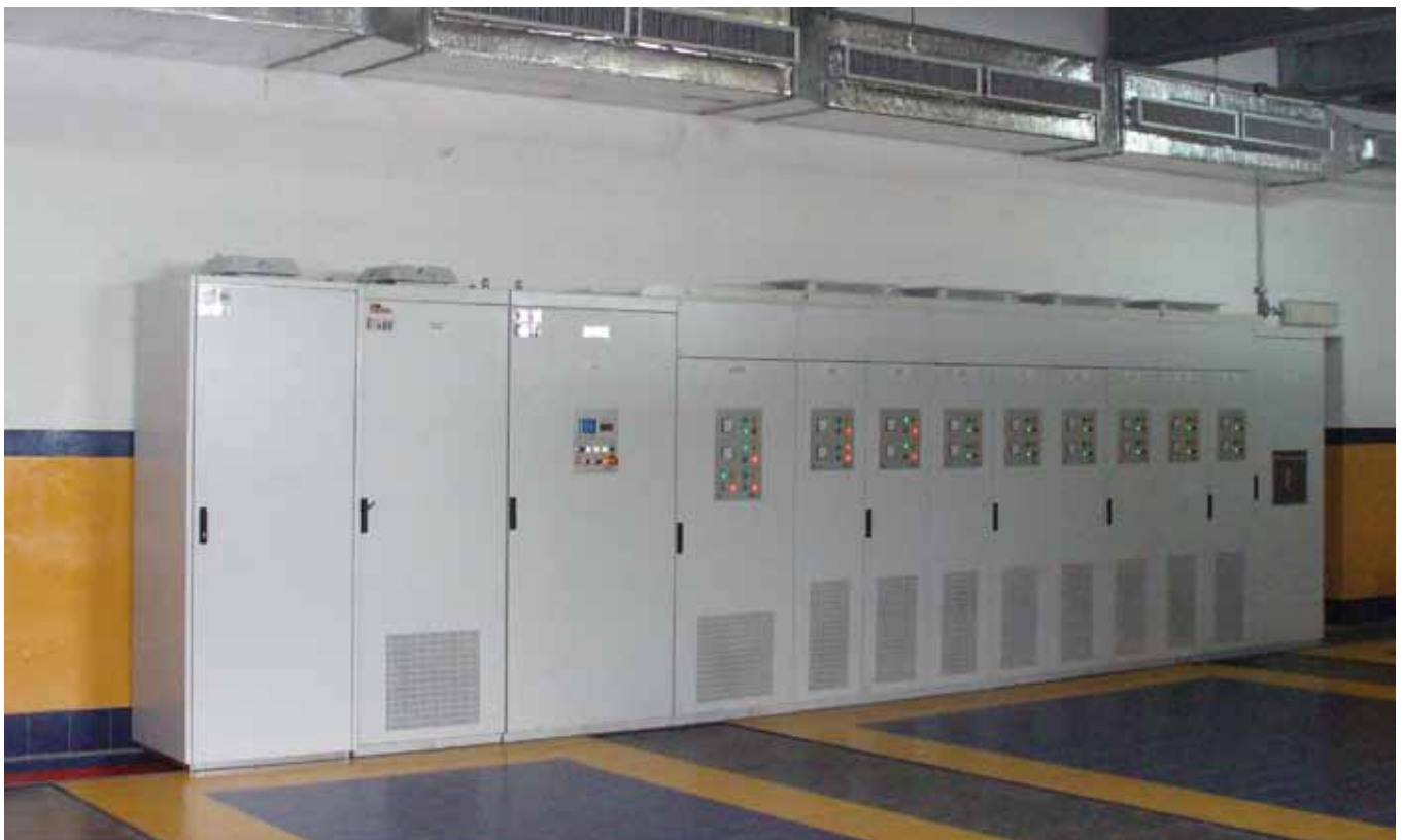
Quadro per centrale OME/MUA - ILVA - Taranto